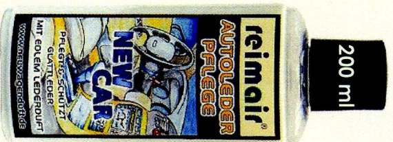
2300 Ft Áfa