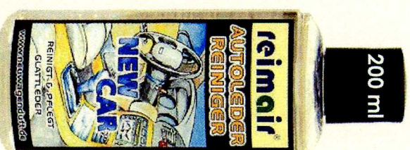
2800 Ft Áfa

Alkalmazás: Egy puha textilre (pl. mikroszálal-törölkendő), öntsön egy kis mennyiségű reimair® NewCar bőrtisztítót és törölje át a bőrt alaposan. Legjobb eredményt az autóbőr ápolásnál akkor érheti el, ha a bőrtisztító használatát követően, a reimair® NewCar bőrápolóval kezeli rendszeresen autóját. Ilyen alkalmazás garantálja Önnek, hogy autója sokáig megőrizi értékét és a bőr bevonatok minősége hosszú időn keresztül kiváló marad.