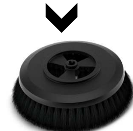
Home & Garden